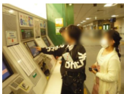
券売機の利用の様子