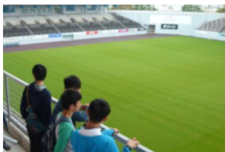
鳥栖 駅前不動産スタジアムを見学