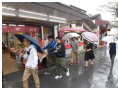
太宰府 参道を散策