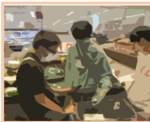
食材を購入します