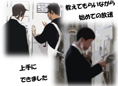
上手にできました

ハンカチのチェック、シャボネットの補充、朝の放送など衛生面に関するを行っています。