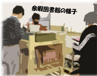
余暇図書館の様子

余暇図書館(移動図書館)での貸し出しや図書管理、余暇道具の点検などを行っています。