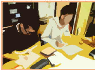
その日の買った物の計算をします